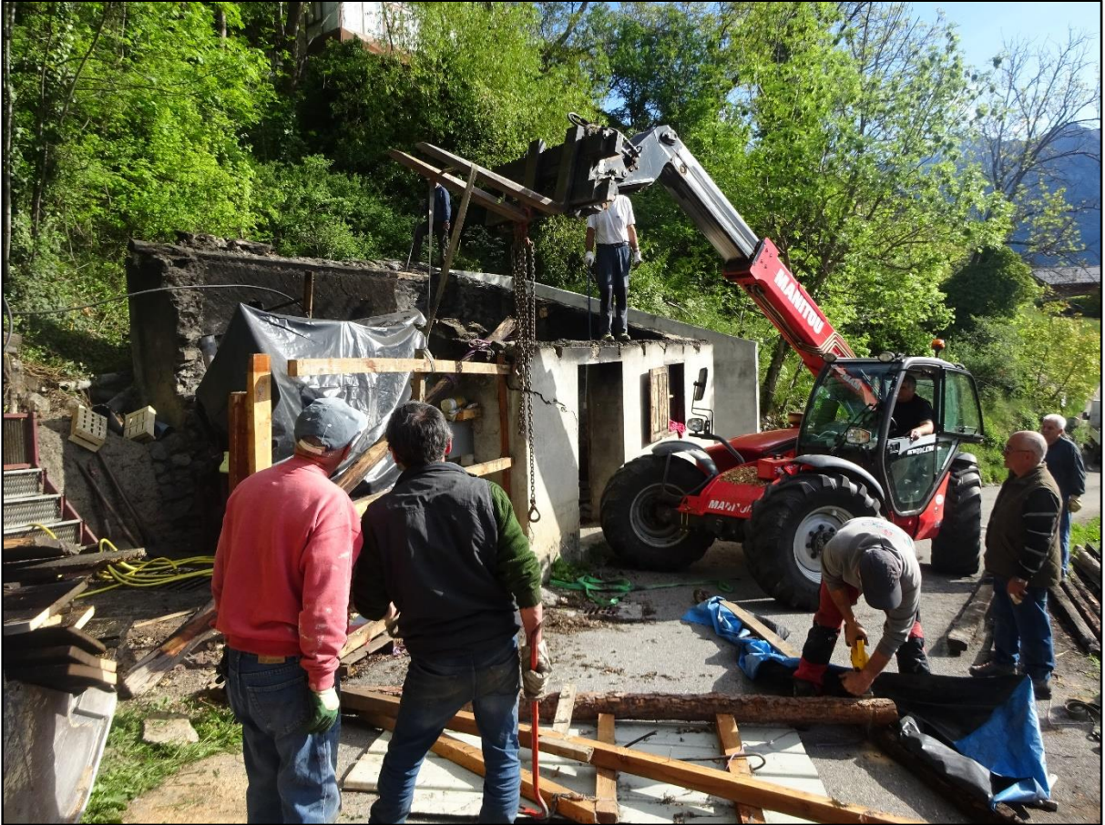
La silhouette du bâtiment de l'alambic ne sera jamais plus comme avant.