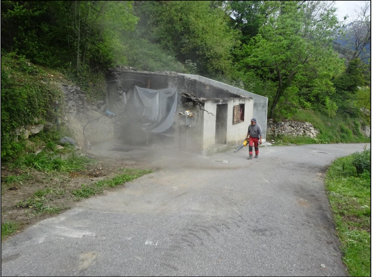
Fred le Belge passa un coup de soufflante.