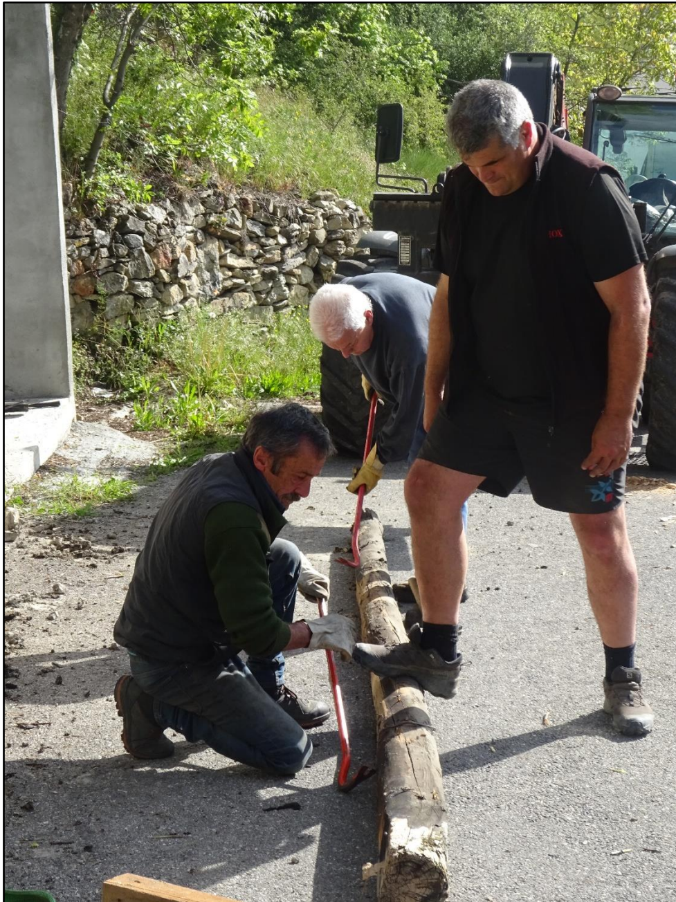
Etape de travail manuel, rien n'est laissé en plan sur place.