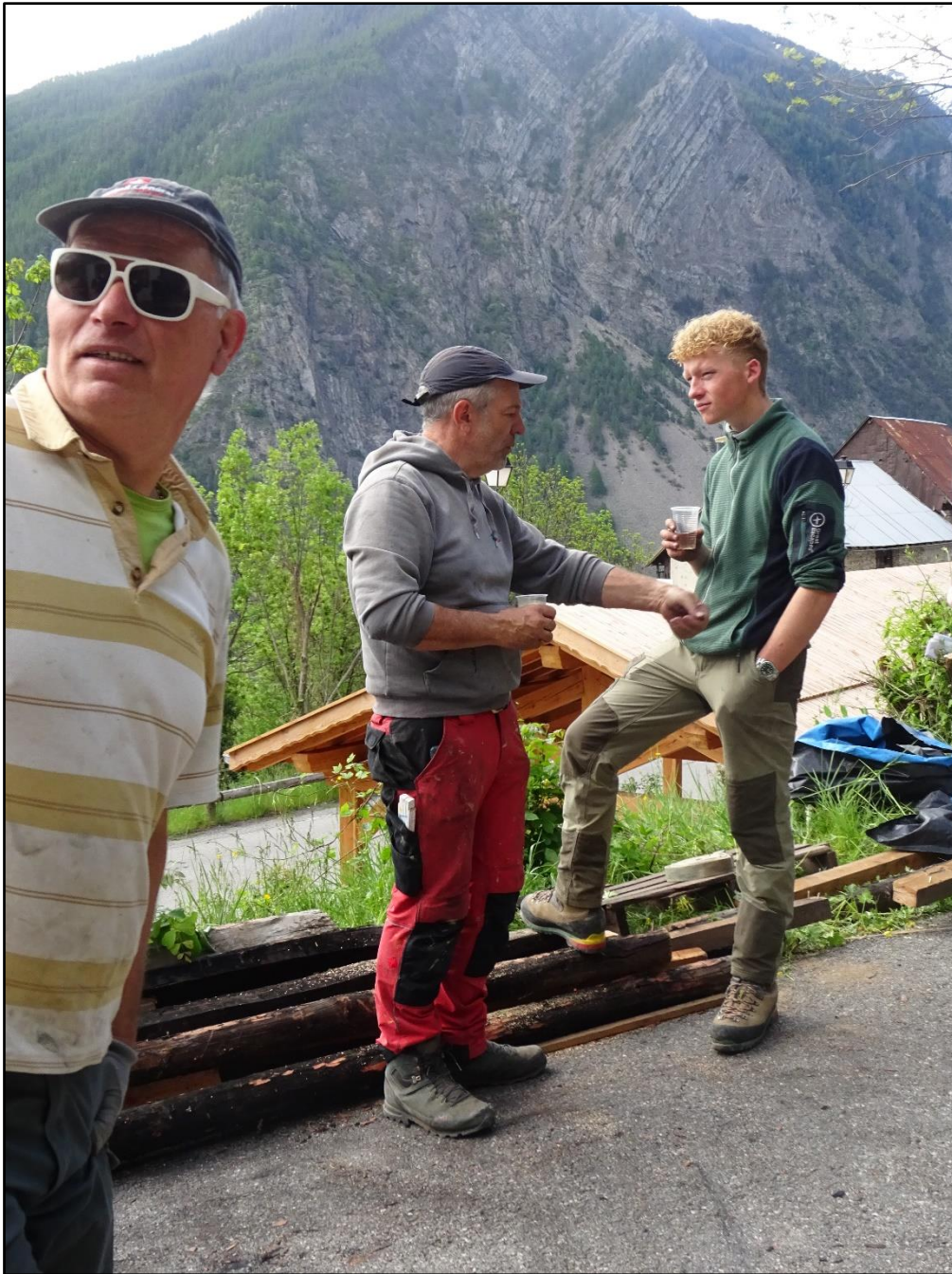
On but un coup.