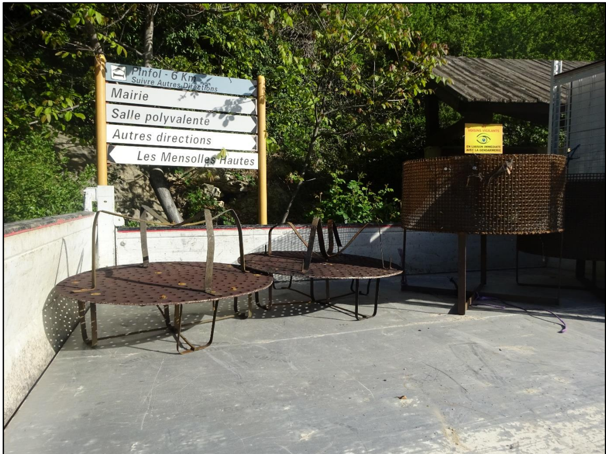
Une partie du matériel de distillation évacué dans le camion.