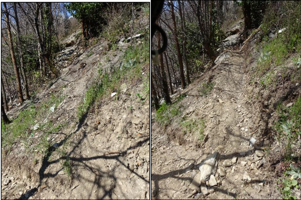
Vue vers l'amont avec le jeu avant / après les coups de pioche.