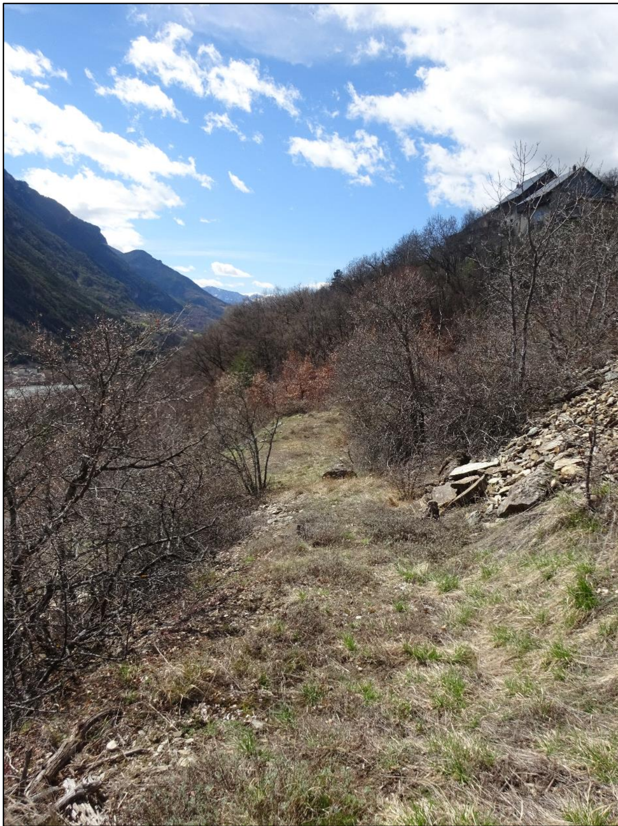
A droite les Mensolles.