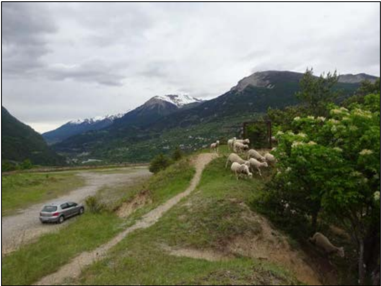
Dans le fort de Mont-Dauphin.