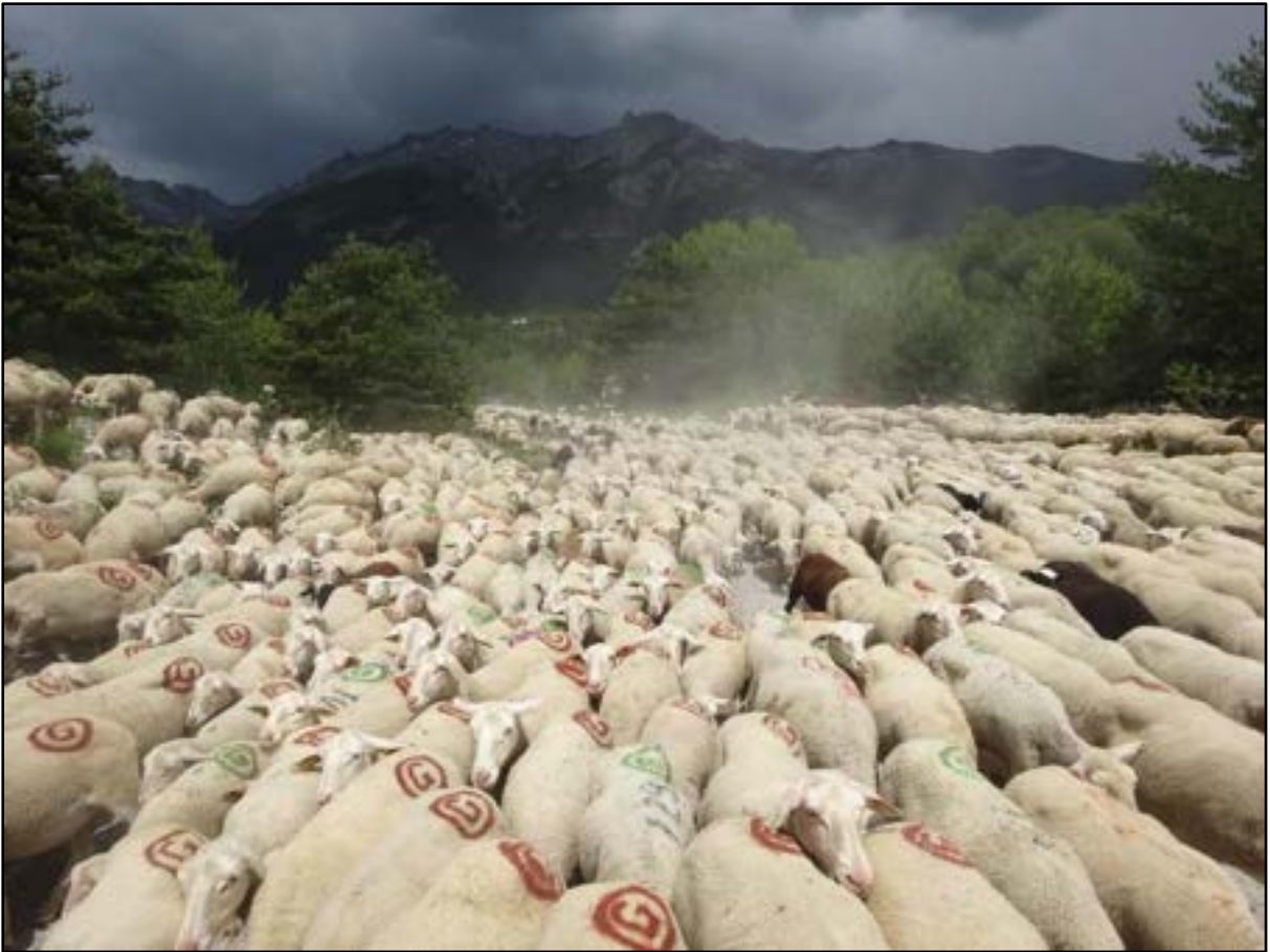
Ciel noir, troupeau bien compact et un peu de poussière.