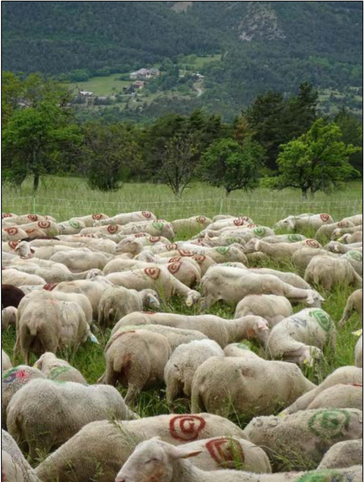
Bien en face de Saint-Thomas.