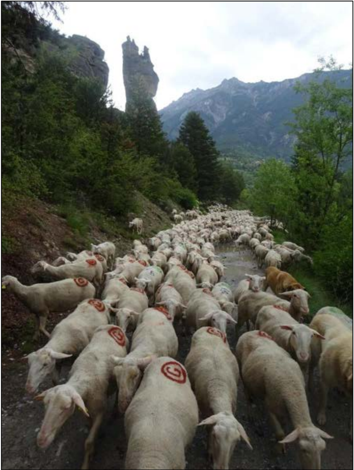
Descente de Boyère par le bord du Guil et la Main du Titan.