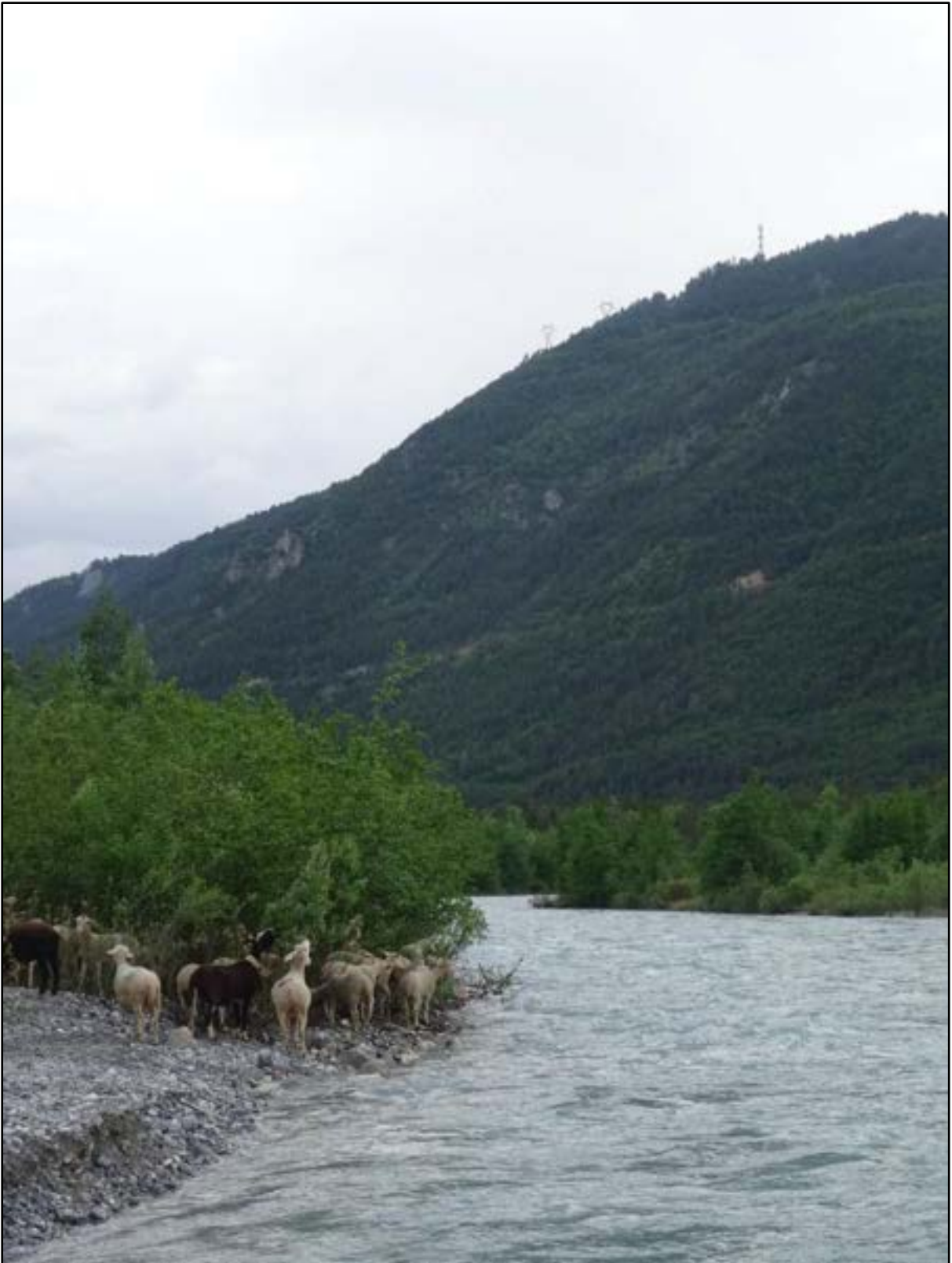
La piste de l'Aiguille, la ligne électrique, le relais de Truchet. Et la Durance.