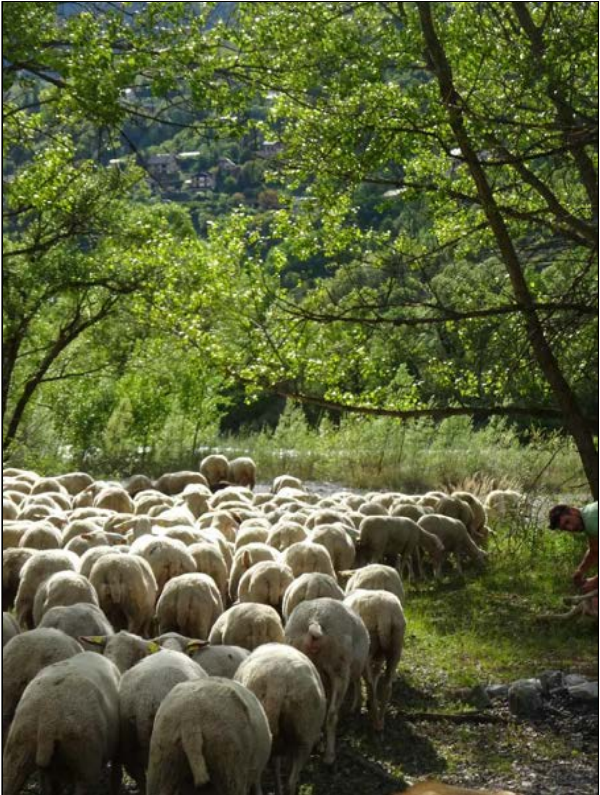
Au Plan de Phazy sous le confluent Guil Durance, commune de Guillestre.