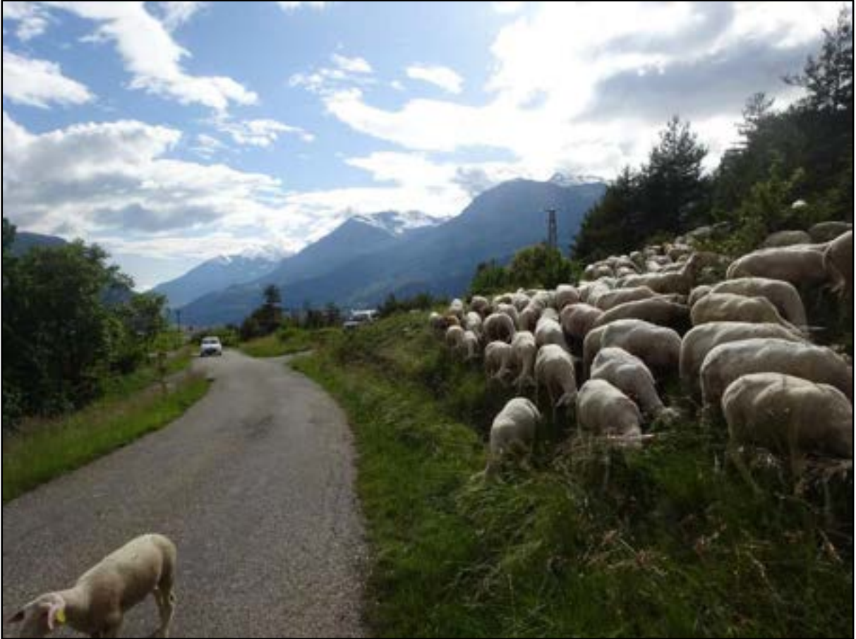
A gauche pris dans les brumes le Mont Guillaume, au centre Clotinailles et à droite Fouran surmonté par le Pinfol autrement dit la Vieille encore sous la neige.