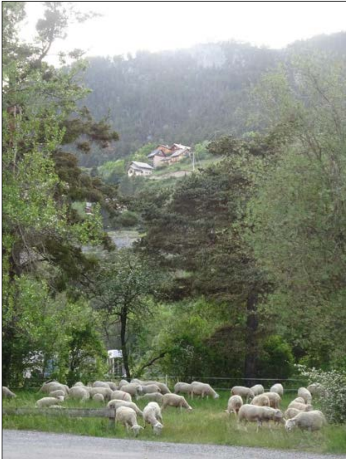
Quelques maisons du Cros sortent des arbres, bien plus haut c'est la crête de Ville à l'horizon.