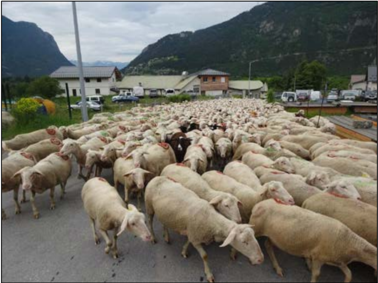
En remontant la ZA de Guillermin sur Saint-Crépin. Derrière les maisons le Cros, et plus à droite la piste forestière de l'Aiguille.