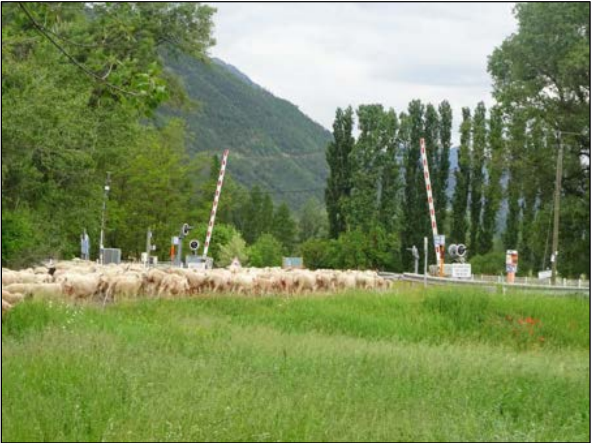
Saint-Guillaume, les bords du Guil et le passage à niveau avant le Plan d'eau d'Eygliers.