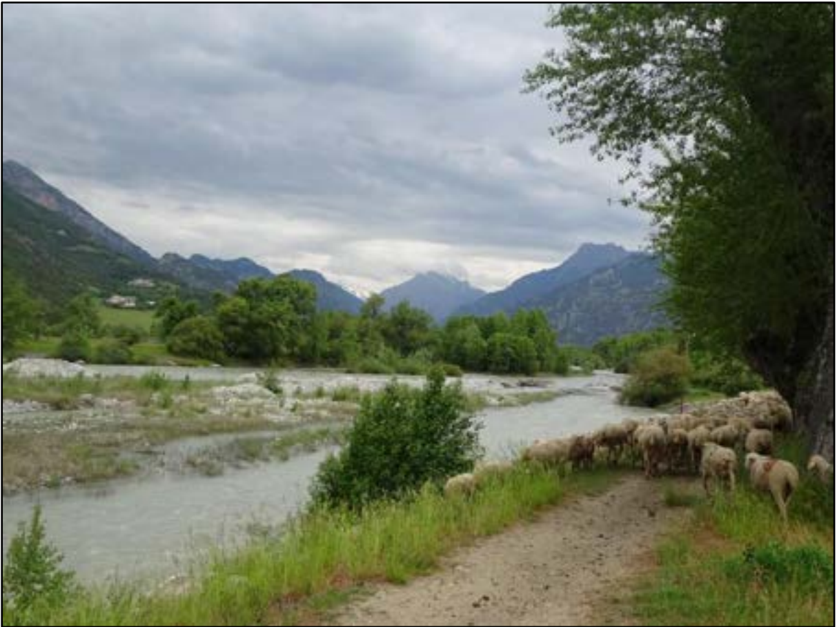
Sur la digue de la Durance au niveau du Plan d'eau, avec tout à gauche Saint-Thomas et plus haut les Eymards de Saint-Crépin.