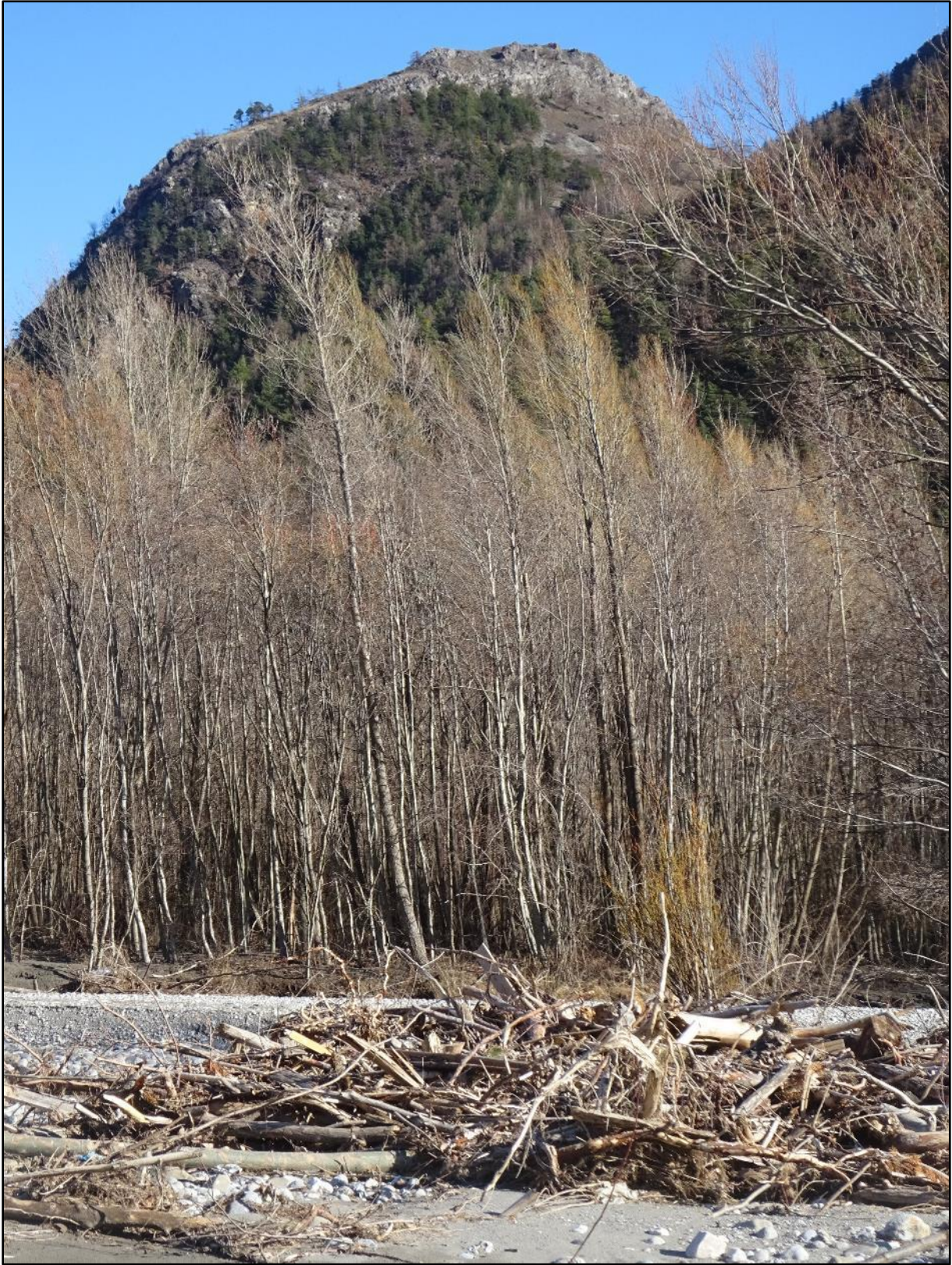
Tas de bois, gravier, ripisylve, et au-dessus contemplant tout cela, le rocher de Barbein.