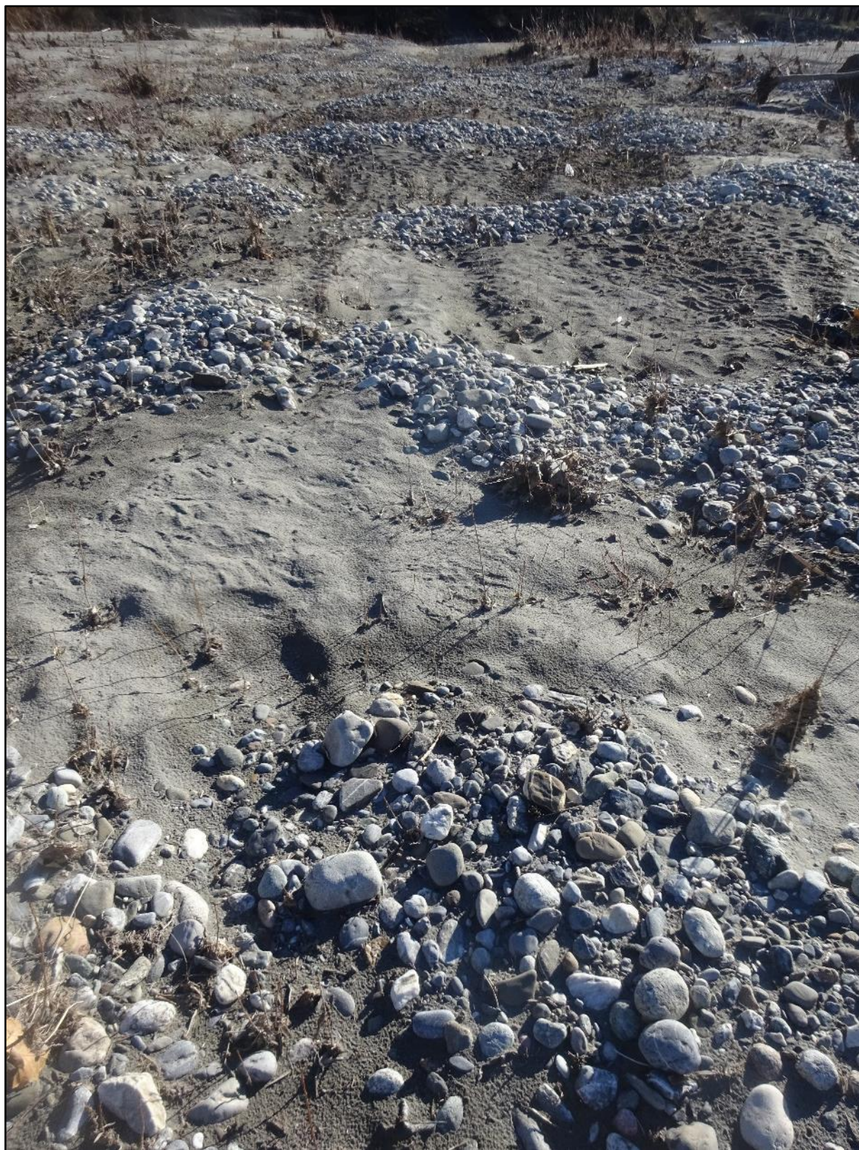
Alternance de galets et de nite en bas de la Drague.