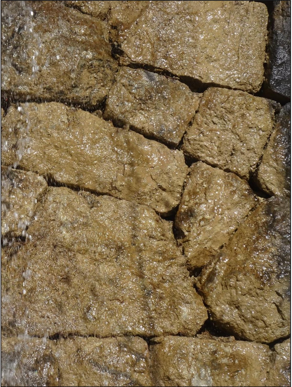
La partie ancienne vue de très près.