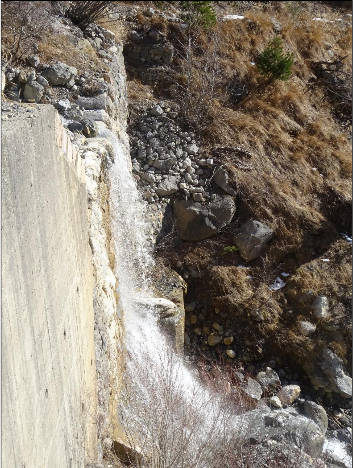
Vue de profil du seuil hybride béton / agencement de pierres.