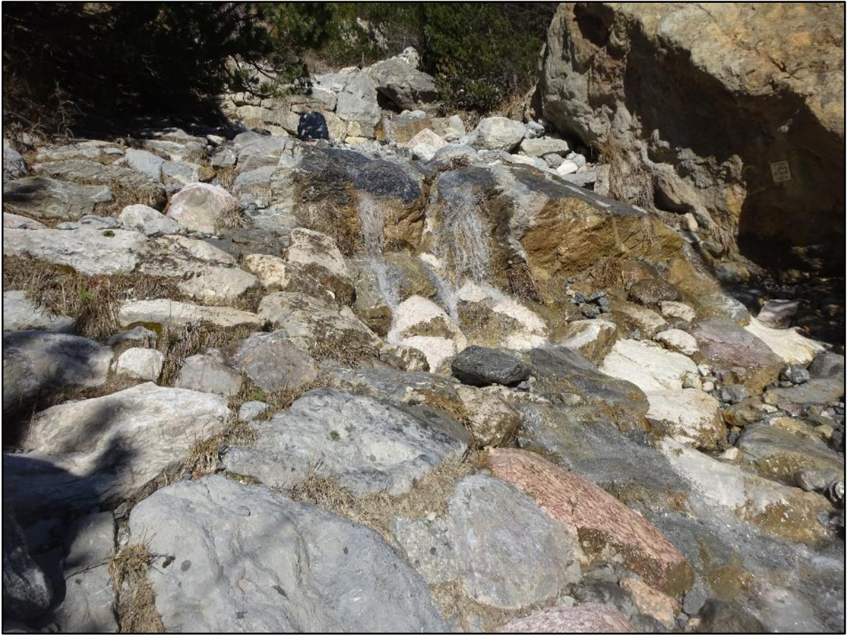
Une surface dallée en pente entre deux seuils.