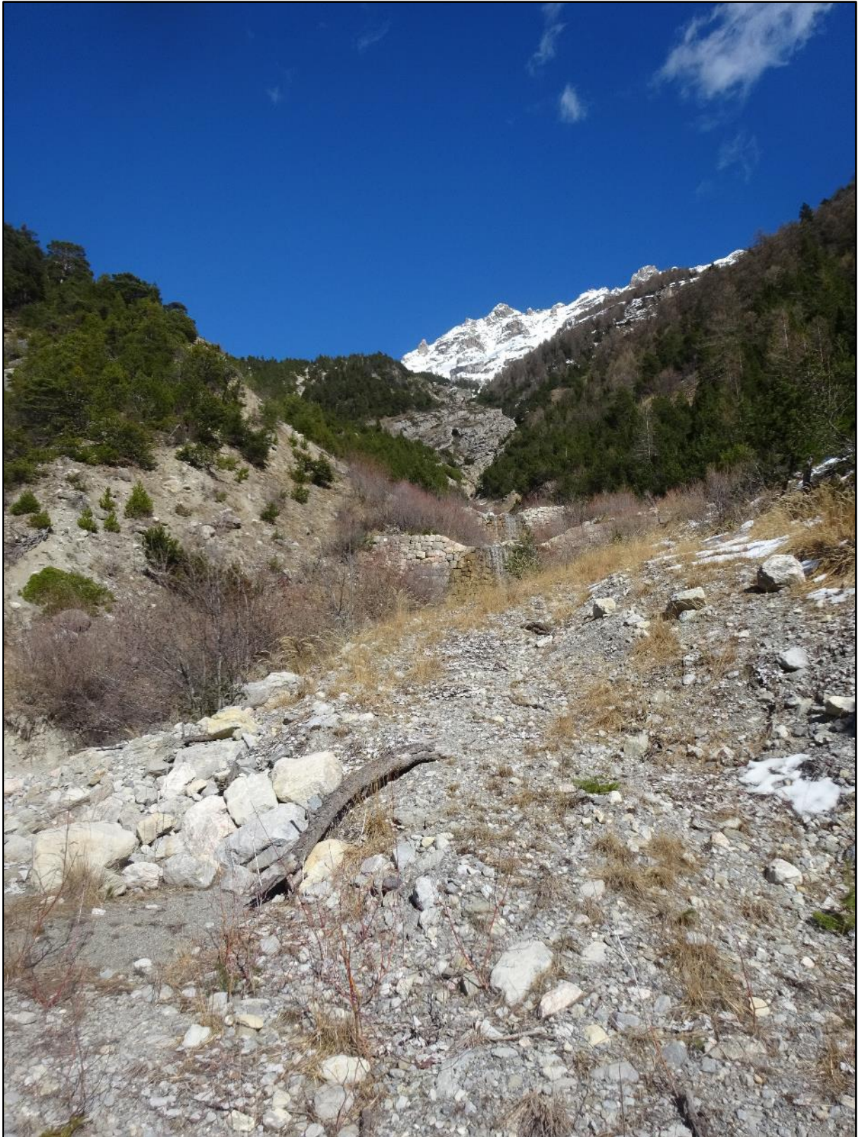
Vue générale du secteur, avec deux autres seuils.