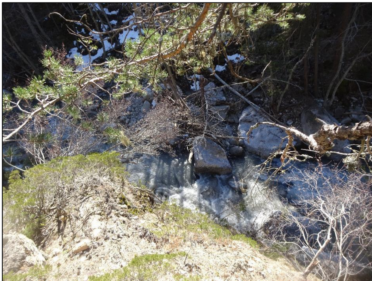
Vue à la verticale.