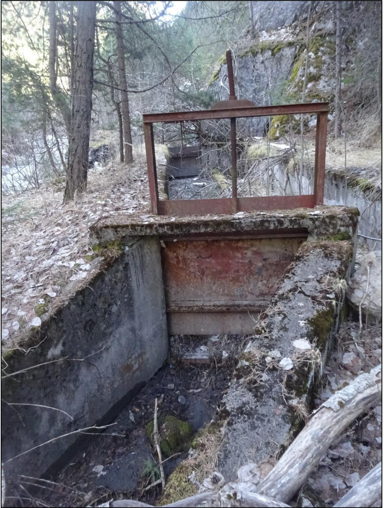
Arrivée à une chambre d'eau avec vannes.