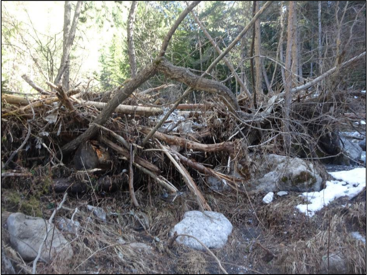
En bordure du Chagne.