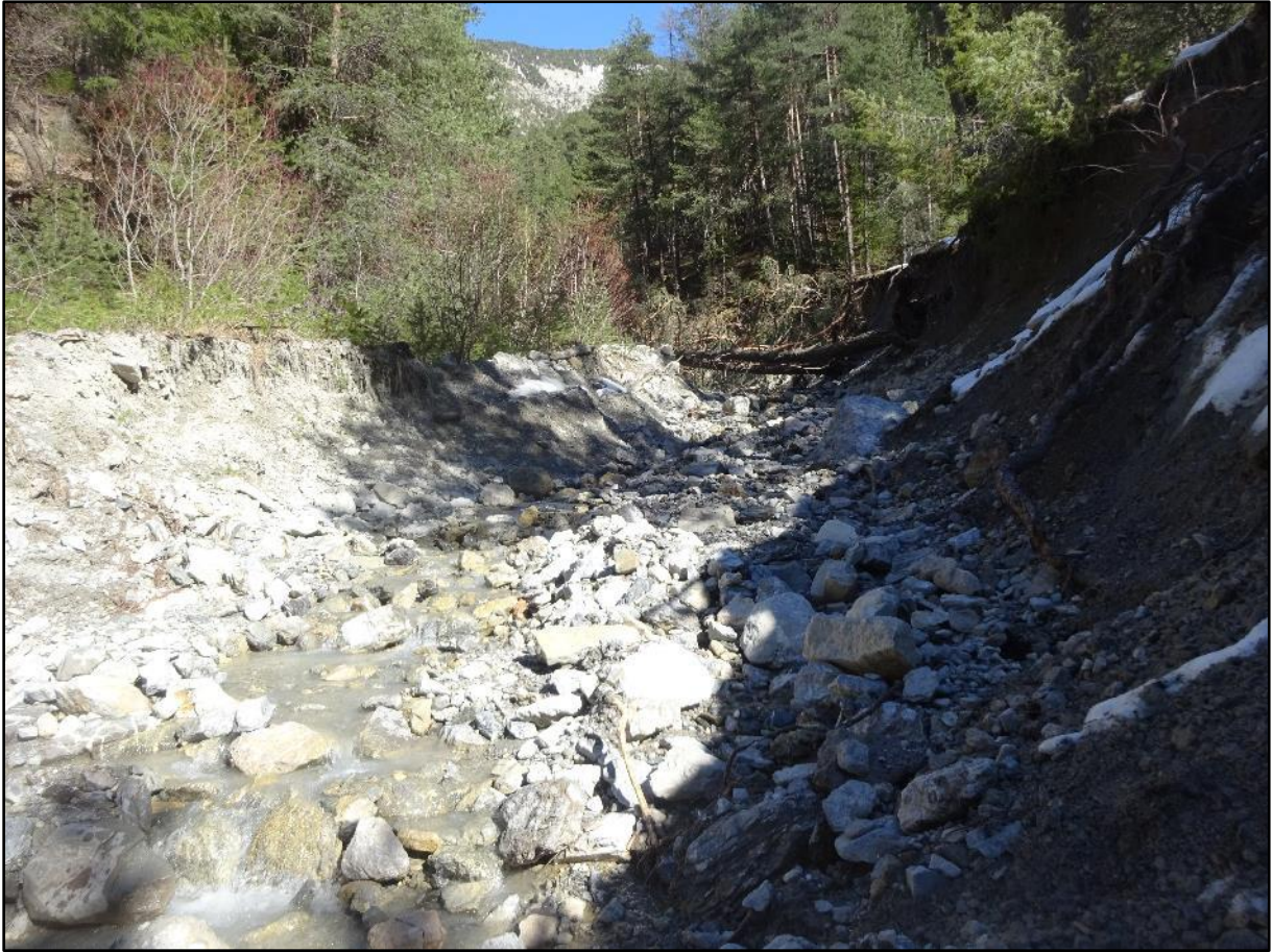
L'arrivée bien large du torrent de Pisse Vache.