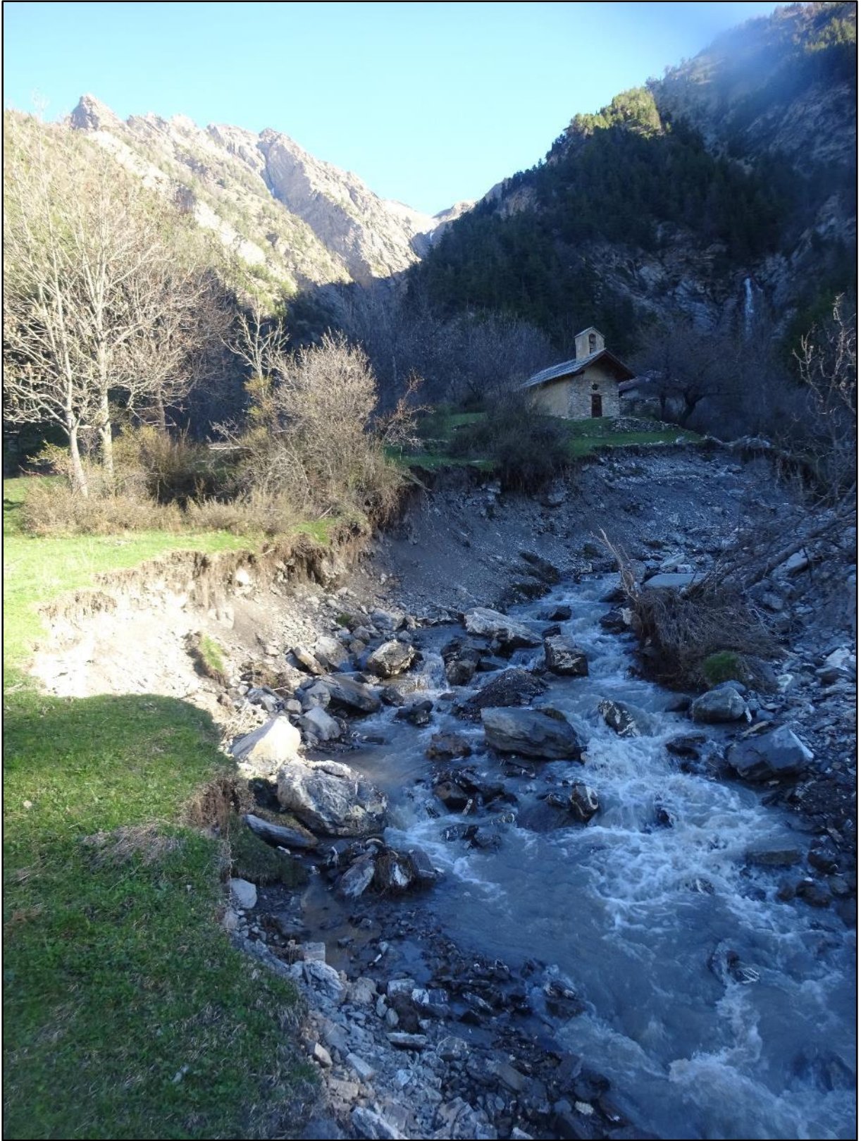
La nouvelle trilogie des Florins : la chapelle, la cascade et les dégâts.