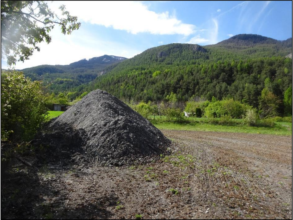
La pyramide de terre noire, mais aussi un terrain travaillé et fumé.