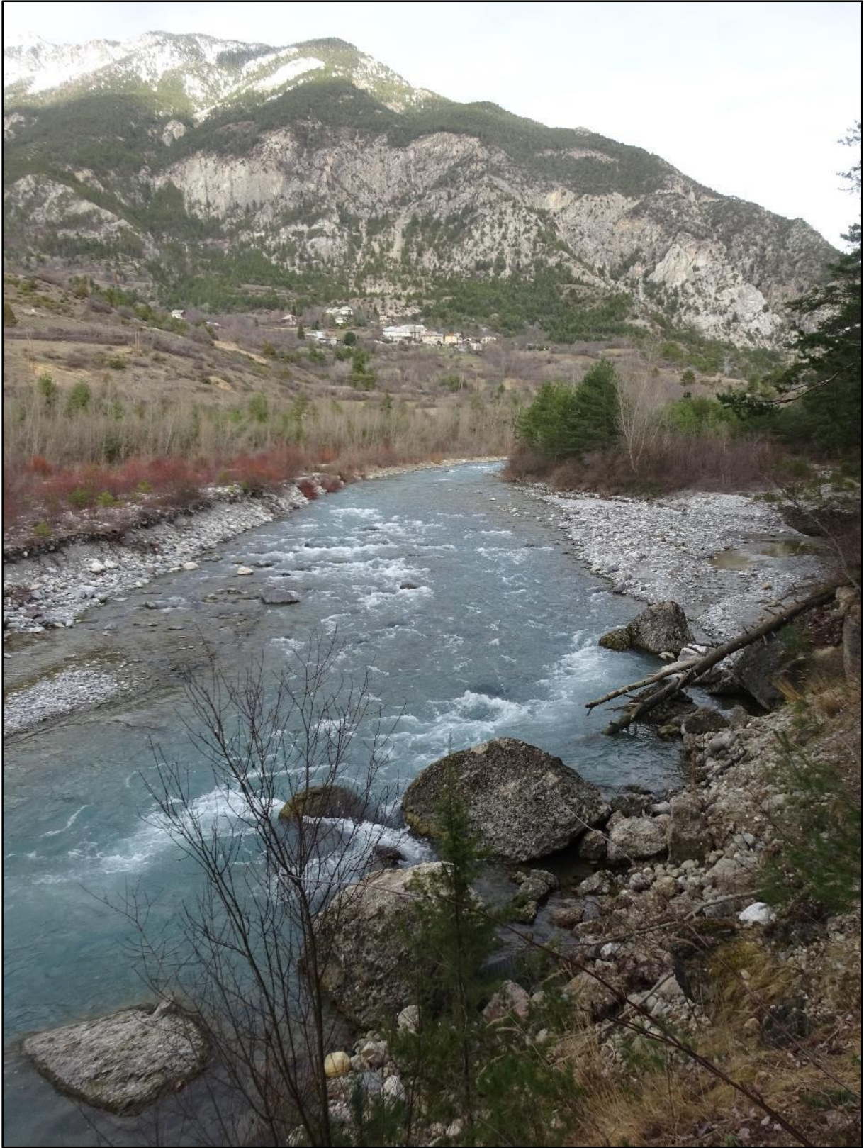
Un passage en hauteur, le cours d'eau et la Font d'Eygliers en vue.