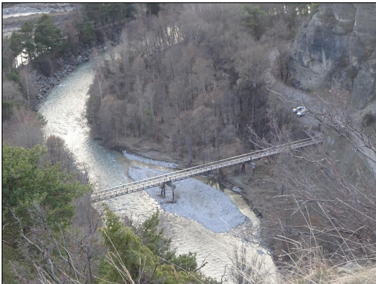
La passerelle de Gaboyer vue depuis le plateau.