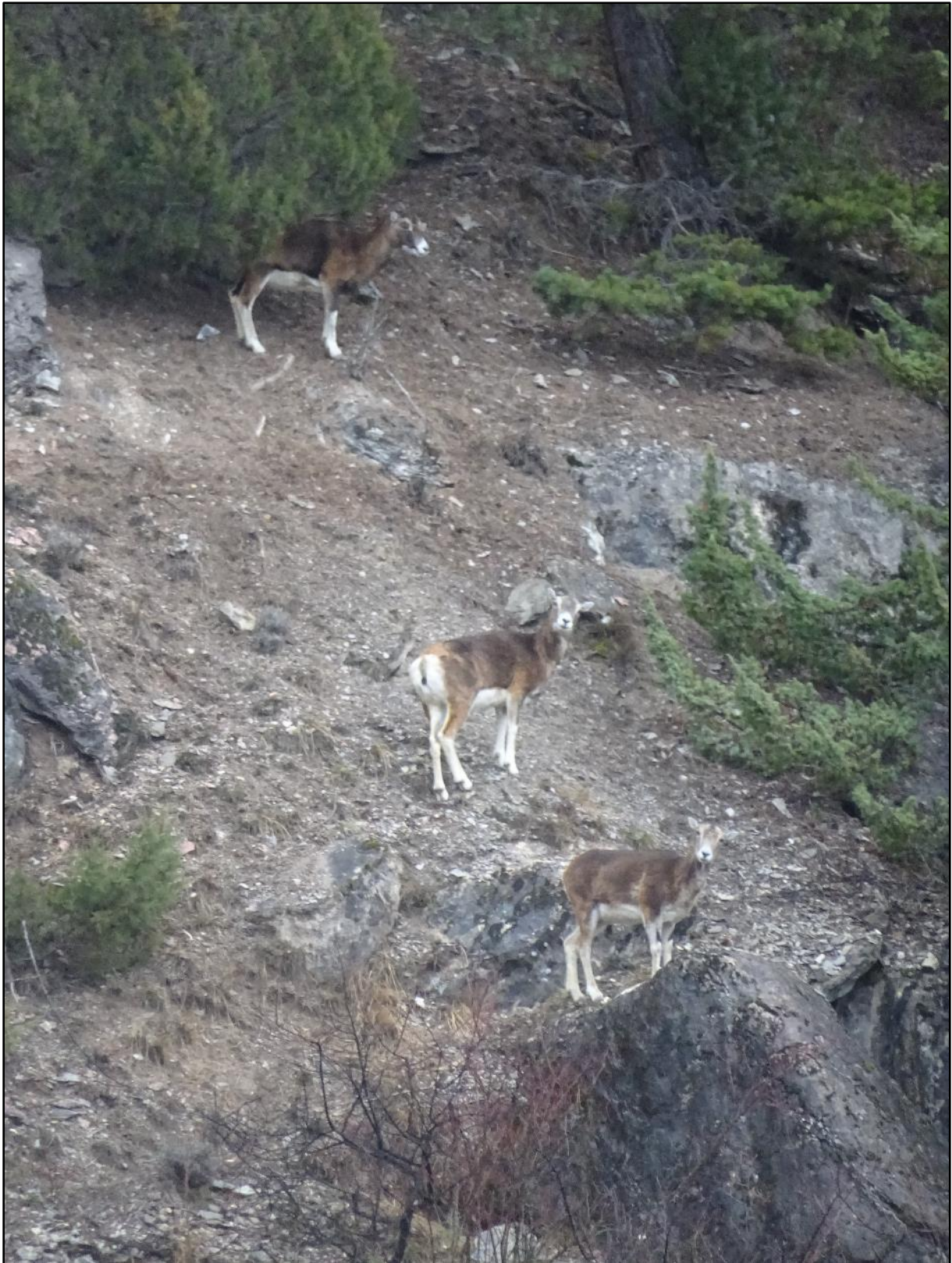
Une rencontre qui n'était pas prévue.