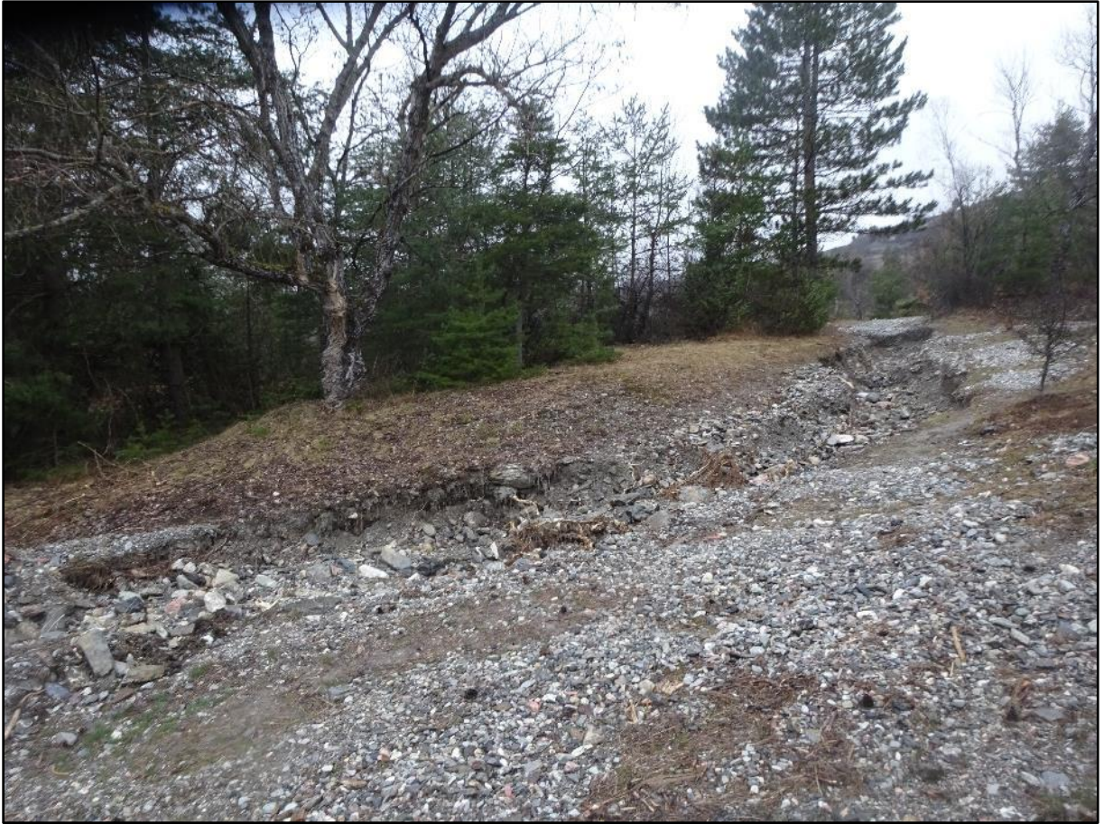
Une ravine à proximité de la route.