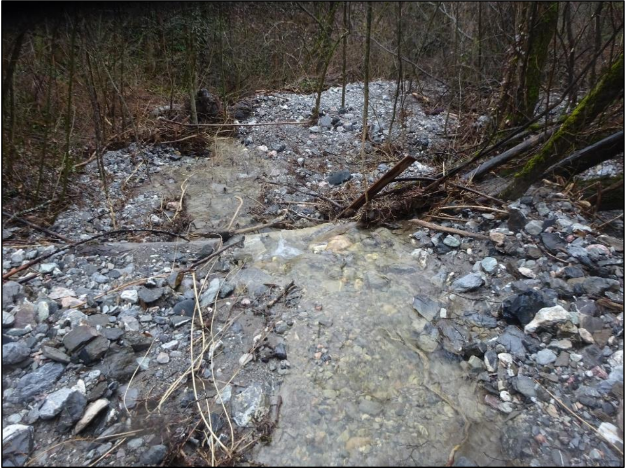
Vue vers l'aval. Des dépôts de gravier et des branchages.